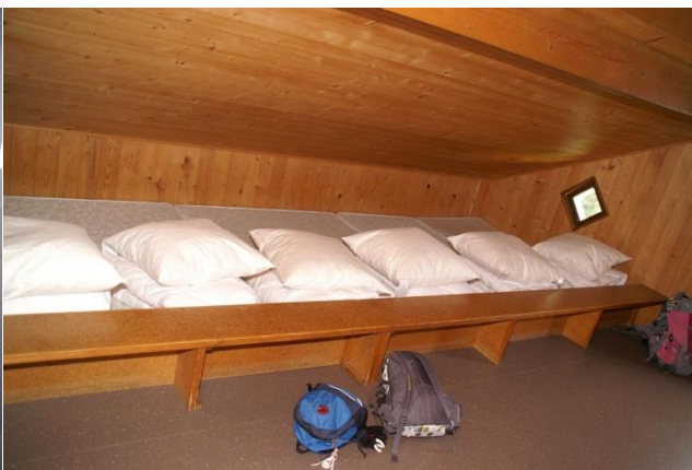
Waschraum und Zimmer

Gästen, welche im Skihaus übernachten, steht der Clubraum mit Küche zur Verfügung. Die Küche ist mit Geschirr und den wichtigsten Kochutensilien ausgerüstet (Kaffeemaschine Nespresso vorhanden). Sämtliche Nahrungsmittel inkl. Gewürze und Getränke sind selbst mitzubringen. Die Zimmer und der Clubraum mit Küche sind nach der Nutzung in sauberem Zustand zu verlassen.