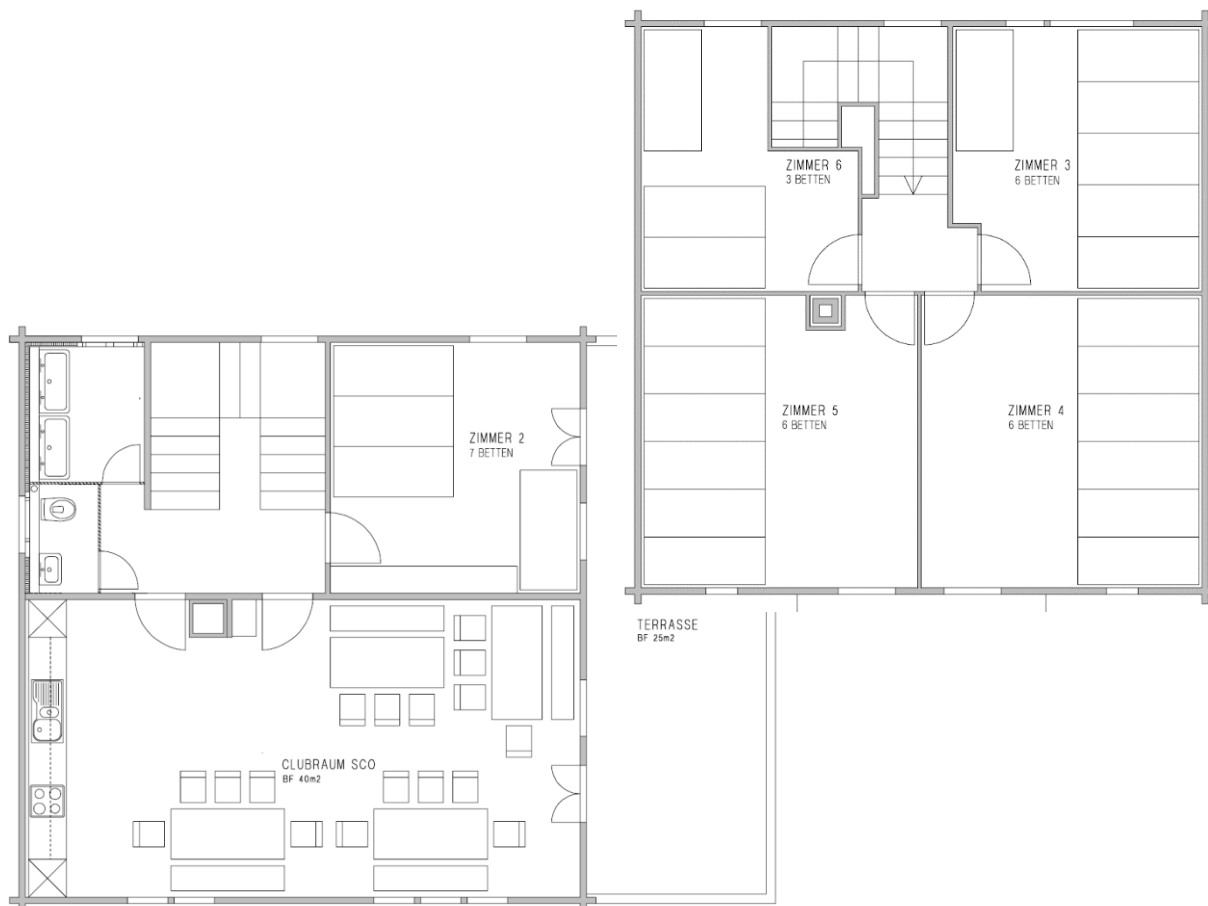
Grundrisse Ober- und Dachgeschoss