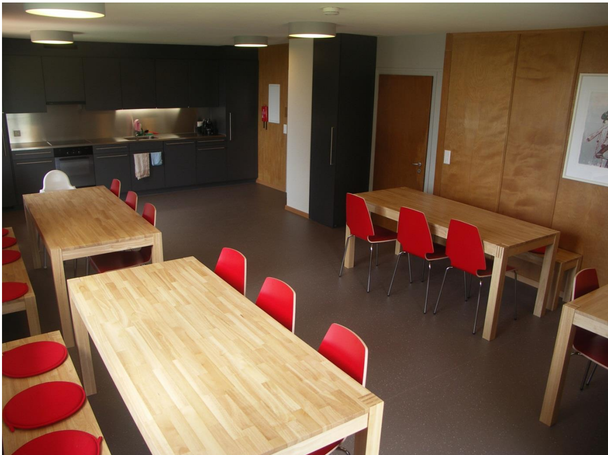
Clubraum mit Küche

Im Erdgeschoss stehen den Gästen ein Skiraum, eine Garderobe/Schuhraum sowie eine Dusche zur Verfügung. Im Ober- und Dachgeschoss bietet das Haus in 5 Mehrbettzimmern 28 Schlafplätze, alle mit neuwertigen Duvets und Bettwäsche ausgestattet. 2012 hat der Skiclub Oberwil-Zug sämtliche Sanitäreinrichtungen und die Elektroinstallationen erneuert und im Obergeschoss einen Clubraum (Aufenthaltsraum) mit Küche eingebaut.